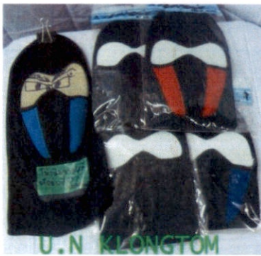
หมวกนินจา