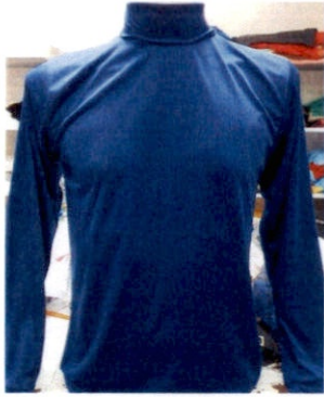
เสื้อแขนยาวคอเต่า