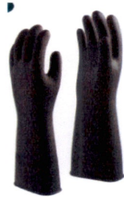
ถุงมือมือยาง